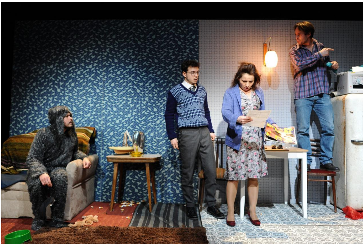
záber z predstavenia Tajný denník Adriana Mola