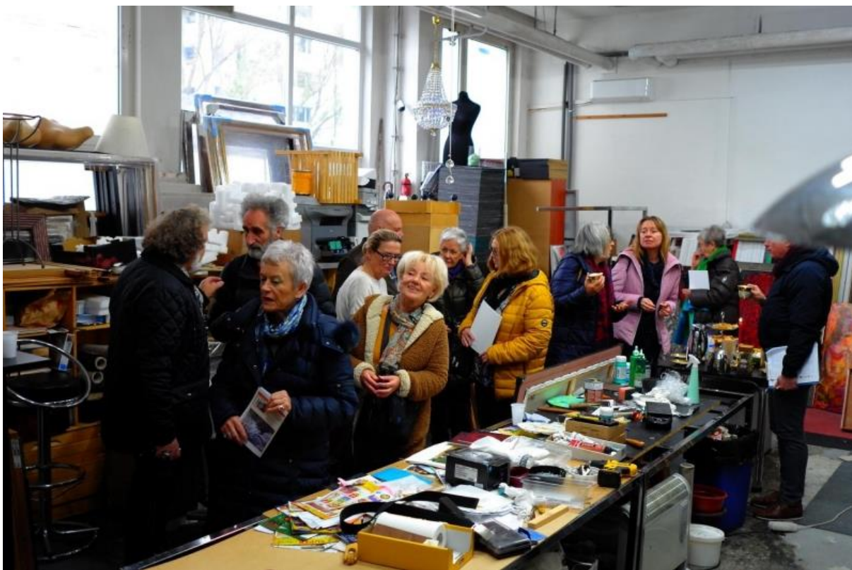
Deň otvorených ateliérov 2019

Malokarpatské osvetové stredisko v Modre (MOS) pôsobí už od roku 2003 v historickej budove kaštieľa na Hornej ulici č. 20 v Modre. Objekt ako aj príľahlá záhrada sú národnými kultúrnymi pamiatkami. Od roku 2017 sa v objekte realizuje projekt „Kultúrne-kreatívne oživenie tradícií“ v rámci projektu Heritage SK-AT, ktorý je financovaný z programu cezhraničnej spolupráce Interreg V-A Slovenská republika – Rakúsko. Cieľom projektu je vybudovať v kaštieli moderné kreatívne centrum na podporu rozvoja tradícií, čím sa obohatí funkcia a ponuka služieb Malokarpatského osvetového strediska. Súčasťou projektu je aj rekonštrukcia kaštieľa a parkovej záhrady. V roku 2019 projekt pokračoval položením strešnej krytiny, čo značne uľahčilo stavebné práce v zimnom období. Z kaštieľa sa stane po ukončení prác moderné kultúrne-kreatívne centrum regiónu s výstavnými priestormi, vinotékou, digitalizačno - dokumentačným pracoviskom a študovňou. Projekt rekonštrukcie zahŕňa okrem rekonštrukcie kaštieľa aj revitalizáciu záhrady. Ukončenie stavebných prác je naplánované na koniec roka 2020. V rámci projektu vzniká aj samostatné digitalizačné pracovisko, v ktorom odborní pracovníci digitalizujú vybrané predmety historického a kultúrneho významu z celého Bratislavského kraja. Každý zdigitalizovaný predmet je zdokumentovaný v 2 D rozmere a má spracovaný popis, je zaradený do databázy, ktorá sa bude v budúcnosti rozrastať a uchovávať pre ďalšie generácie.