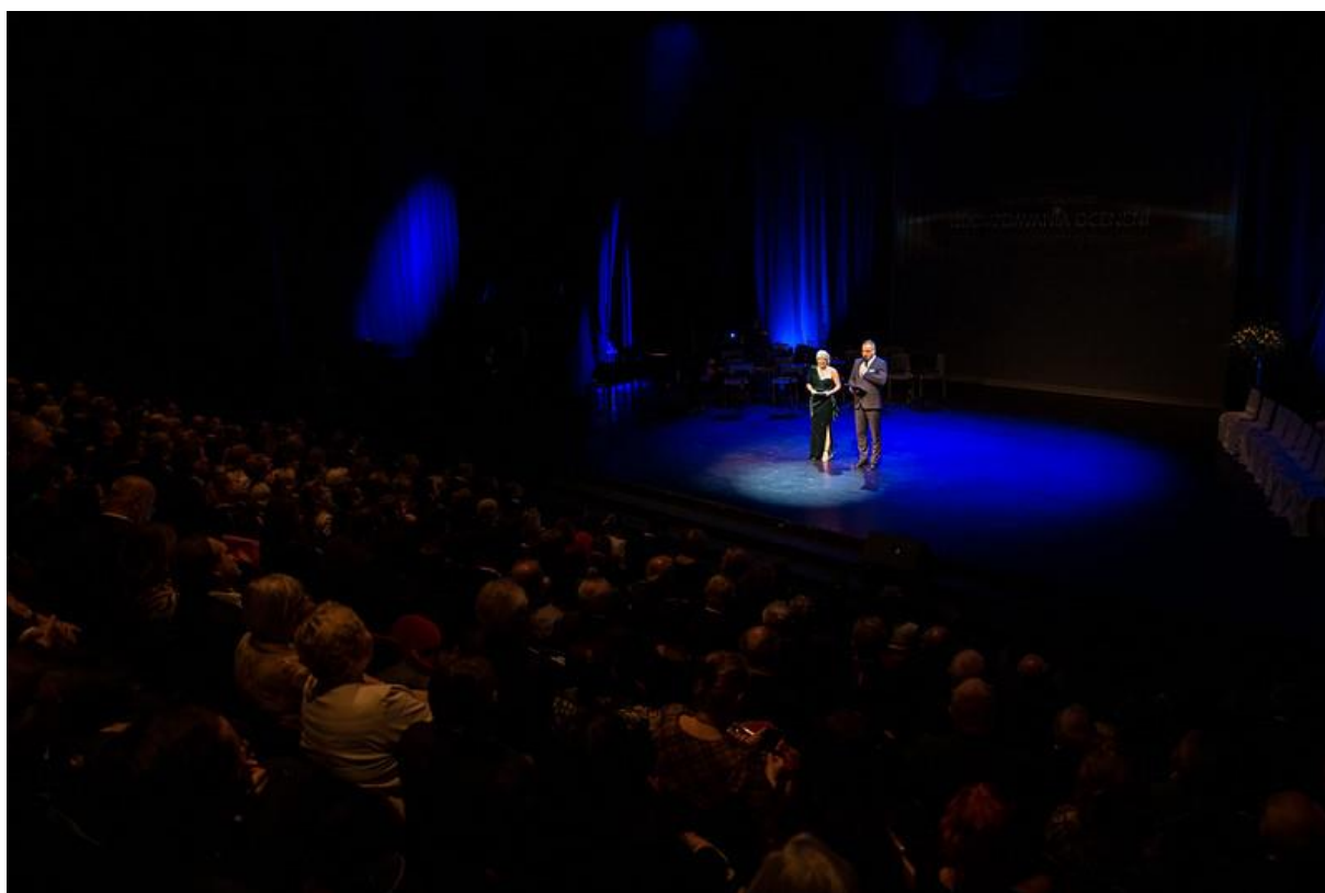
Divadlo ARÉNA, Odovzdávanie Cien Samuela Zocha, december 2019

Divadlo ARÉNA sídli v historickej budove z roku 1898 na petržalskom nábreží Dunaja (Viedenská cesta č. 10). Objekt budovy je národnou kultúrnou pamiatkou a je situovaný na mieste, kde v minulosti stál jeden z najstarších divadelných stánkov v Bratislave – amfiteáter s rovnakým názvom z roku 1828. Budova divadla je vo vlastníctve Bratislavského samosprávneho kraja. Maximálna kapacita veľkej divadelnej sály je 318 divákov, pri štandardnej úprave hľadiska a javiska je to 264 miest. Štúdiový divadelný priestor Loft Aréna ponúka miesta pre cca 80 divákov. Divadlo nemá stály umelecký súbor.