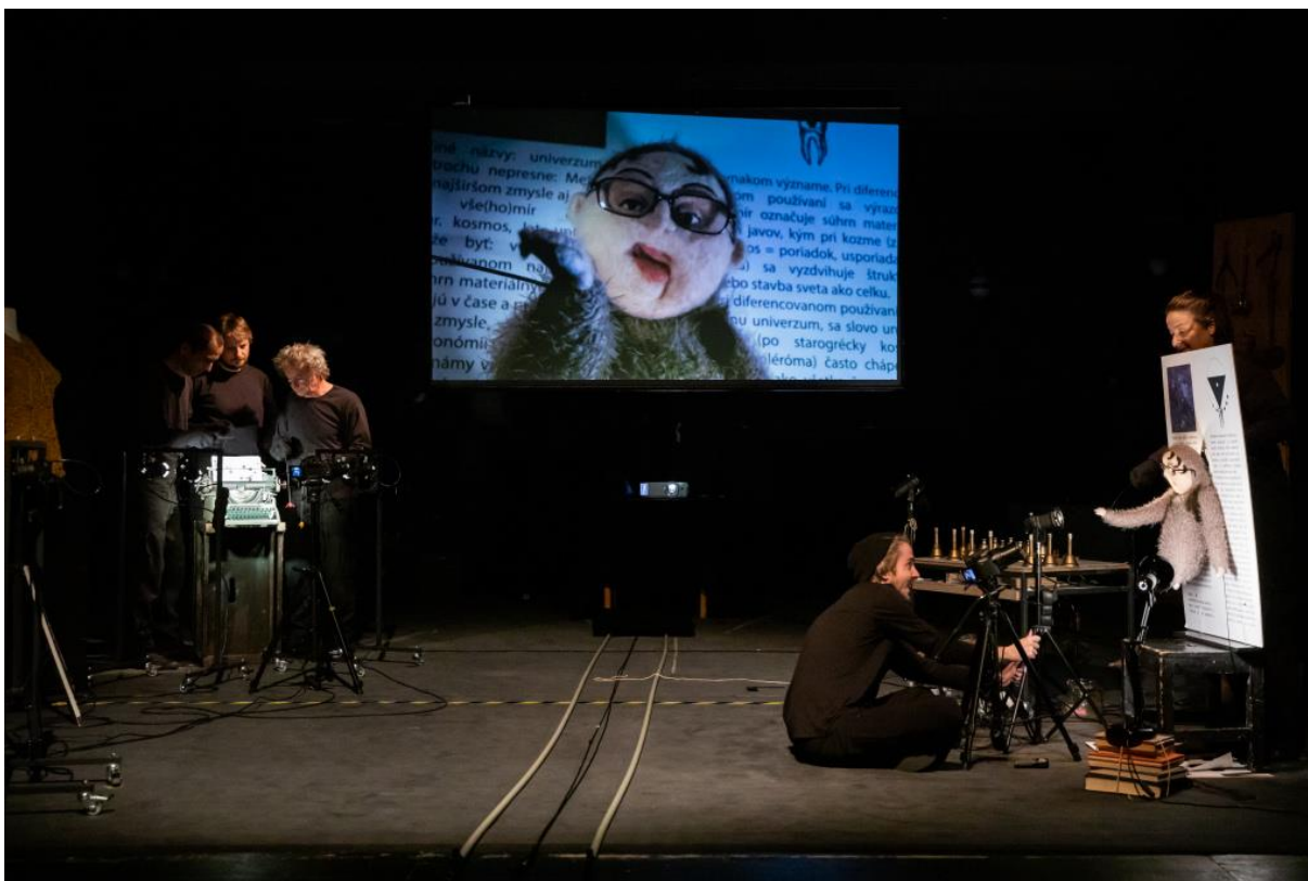
záber z predstavenia Chronoškratkovia,

Sídelnou budovou Bratislavského bábkového divadla (BBD) je historický spolkový dom na Dunajskej ulici č. 36 v centre Bratislavy. Budova je v zlom stavebnotechnickom stave a v súčasnosti prebieha proces rekonštrukcie objektu. Proces rekonštrukcie zdržala náročná aktualizácia projektovej dokumentácie. Pre formálne a vecné pochybenia musel BSK ako zriaďovateľ divadla zrušiť dve verejné obstarávania na zhotoviteľa stavebných prác a rekonštrukcie. Tretie verejné obstarávanie bolo úspešné s predpokladom začiatku stavebných prác v druhom štvrtroku 2018. Po podpísaní zmluvy s víťaznou firmou VO Euro-Bulding a. s., v zmysle výsledkov z verejného obstarávania, sa v apríli 2018 začalo s búracími prácami na divadelnej časti budovy. Pri týchto prácach sa zistilo, že obvodový múr javiska a hľadiska nemá dostatočné základy. Na základe statického posudku bola stavba pozastavená. Na asanáciu existujúceho nosného obvodového muriva javiska a hľadiska bolo následne vypísané nové verejné obstarávanie. Firma Euro-Bulding a. s. na základe dohody vypovedala zmluvu a odovzdala stavenisko objednávatel'ovi. V roku 2019 dodávatelia dokončili búracie práce zadného traktu divadla a projektant dokončil revitalizáciu projektovej dokumentácie. Zo strany BSK bolo potrebné zabezpečiť nové stavebné povolenie a vyžiadať ďalší súhlas z Krajského pamiatkového úradu, pripravilo sa vypísanie nového verejného obstarávania rekonštrukcie divadla.